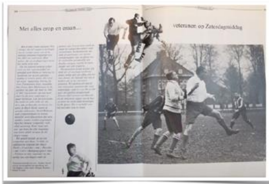
YOUTUBE: Film ONEC 1999 HC & FC Victoria

Klik op de foto of ga naar https://www.youtube.com/watch?v=4uGHnbDWTis