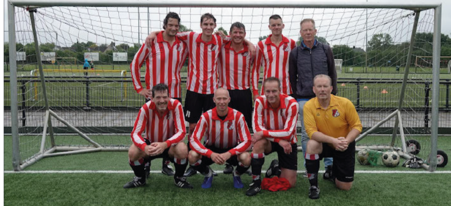
Robur et Velocitas 35+ veteranen.