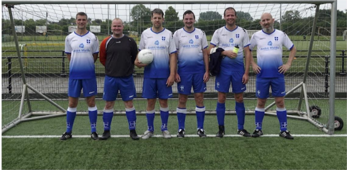
Het WF-team van ZAC (de zevende speler maakte kennelijk de foto)