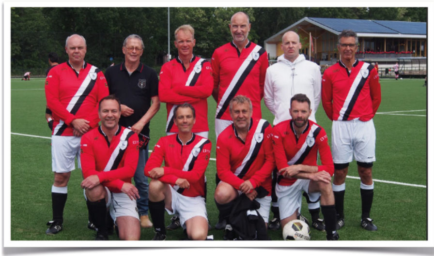
Concordia in mooie shirts voor deze gelegenheid