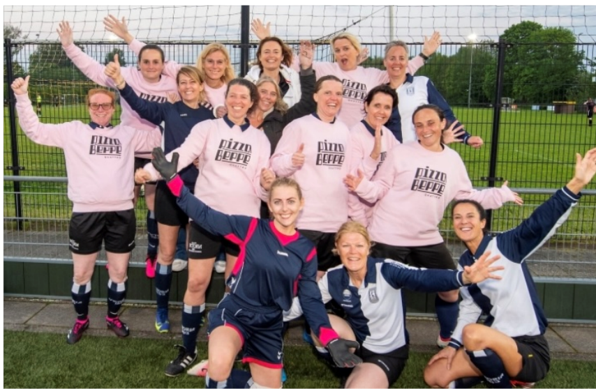
Victoria 30+ vrouwenteam, een deel in kleding van de sponsor.

“Voetballen is voor ons meer dan een sport. Het biedt ons de kans om onderdeel te zijn van een team, plezier te hebben en tegelijkertijd fit te blijven. Voor vele is het naast het drukke werk leven ook een uitlaatklep om met z'n allen een balletje te trappen.