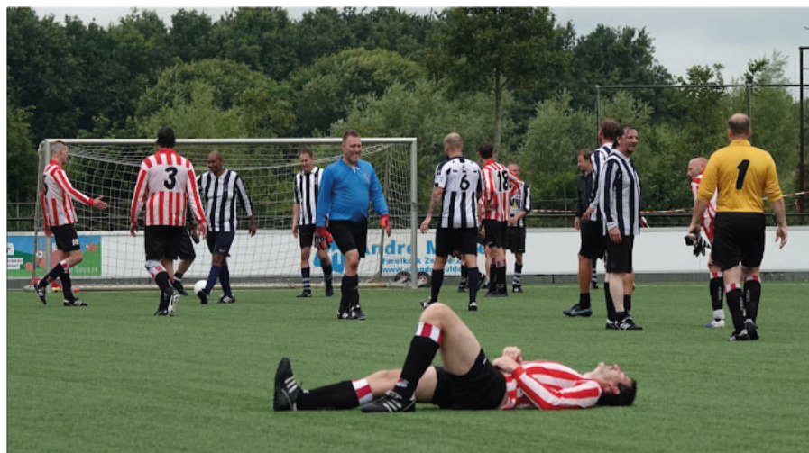
Zit er even helemaal doorheen, de Robur speler in de wedstrijd tegen Hercules