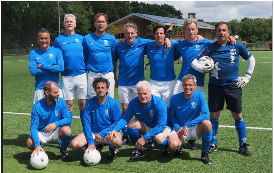
Kampong 35+ met Italiaanse look