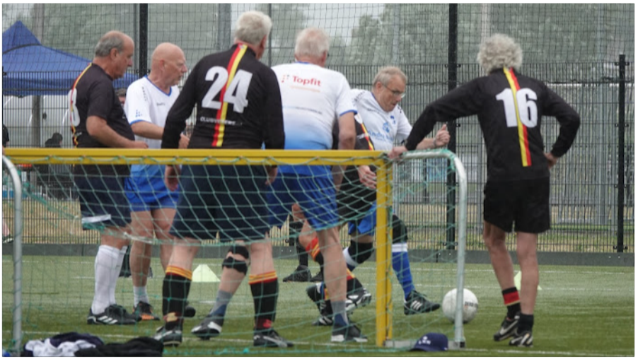
Wandel voetbal LSC – Be Quick. Zwolle 2023 wordt dit een doelpunt of niet Een paar regels, altijd minimaal 1 been op de grond, bal niet hoger dan de heup, geen sliding.