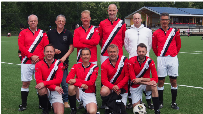
Concordia in mooie shirts voor deze gelegenheid