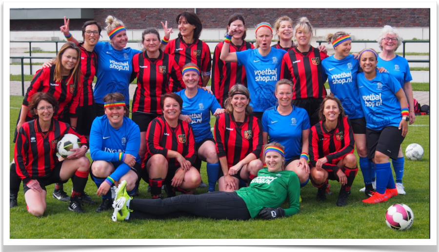
ASC en het Kampongrouwenteams actief op het ONEC – voetbaltoernooi bij ASC in Oegstgeest