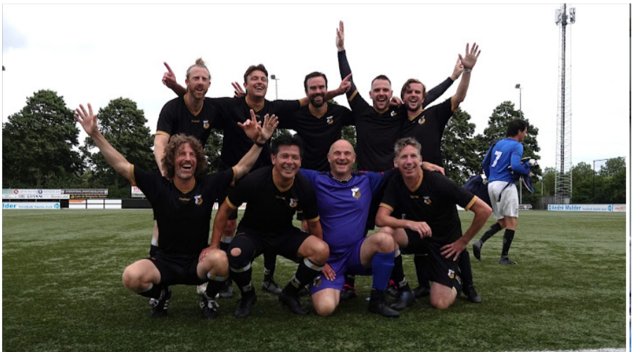
HBS ook winnaar in Zwolle 35+