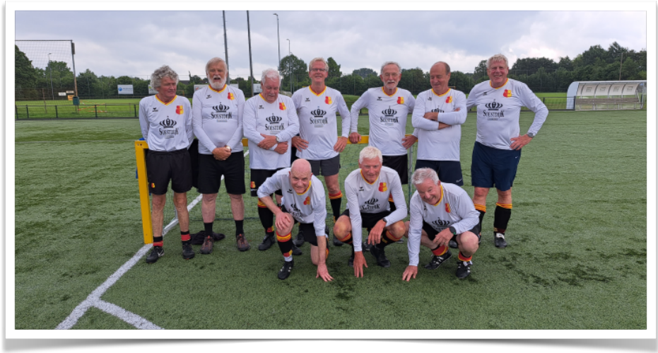
55+ Veteranen Be Quick 1887