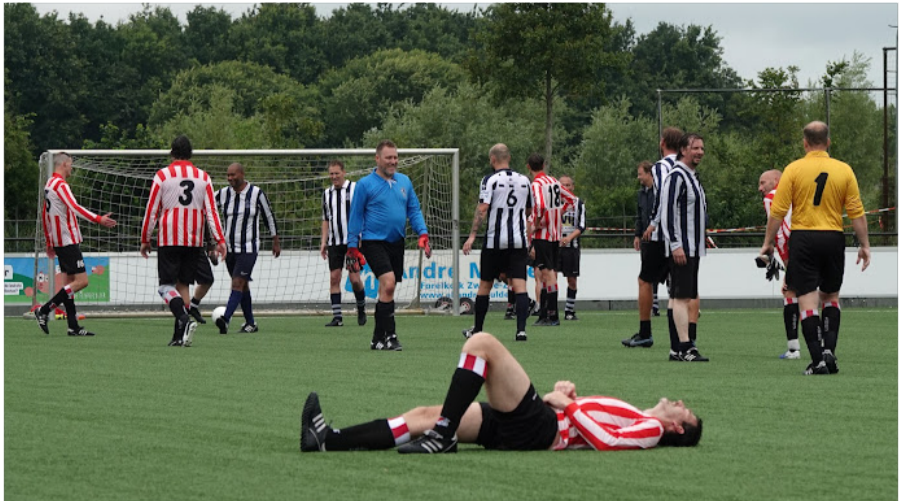
Zit er even helemaal doorheen, de Robur speler in de wedstrijd tegen Hercules