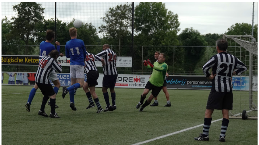
Kampong – Hercules bij ZAC in Zwolle, heel veel druk (drukte om)op de bal.