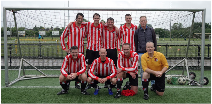
Robur et Velocitas 35+ veteranen.