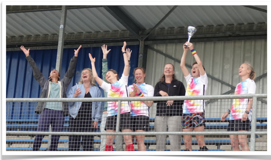
Blijheid bij Kampong 30+ vrouwenteam, eerste prijs in Zwolle