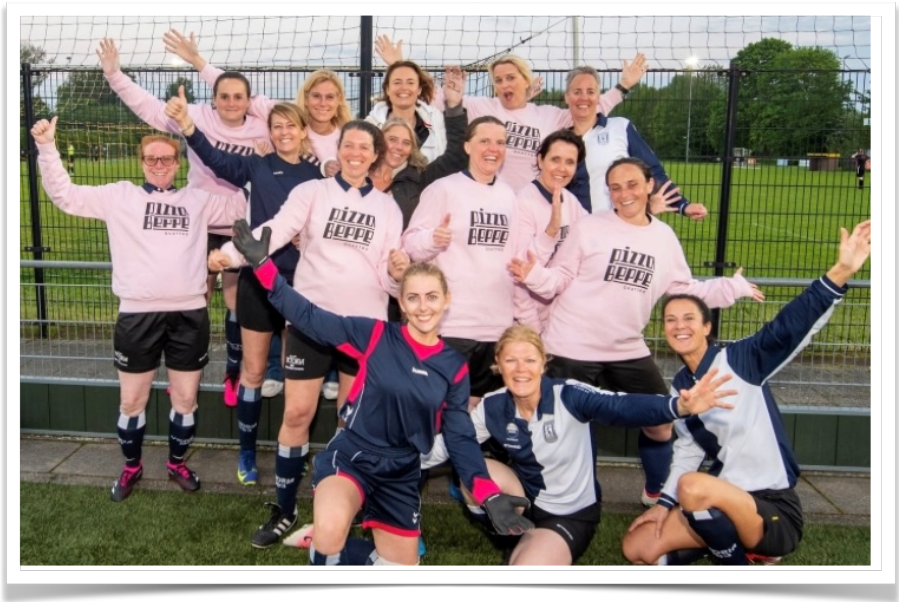
Victoria 30+ vrouwenteam, een deel in kleding van de sponsor.

“Voetballen is voor ons meer dan een sport. Het biedt ons de kans om onderdeel te zijn van een team, plezier te hebben en tegelijkertijd fit te blijven. Voor vele is het naast het drukke werk leven ook een uitlaatklep om met z'n allen een balletje te trappen.