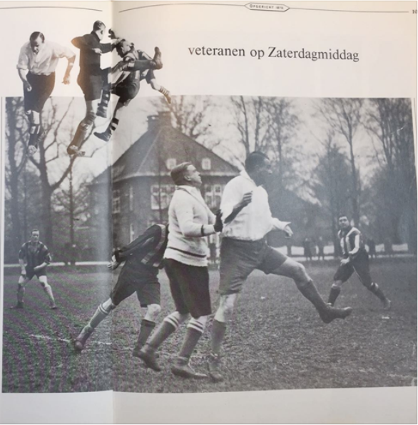
veteranen op Zaterdagmiddag