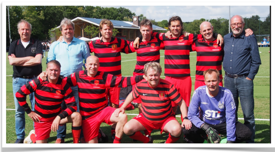
VOC Rotterdam ook aanwezig bij het ONEC-toernooi Oegstgeest, zijn in 2025 onze gastheren